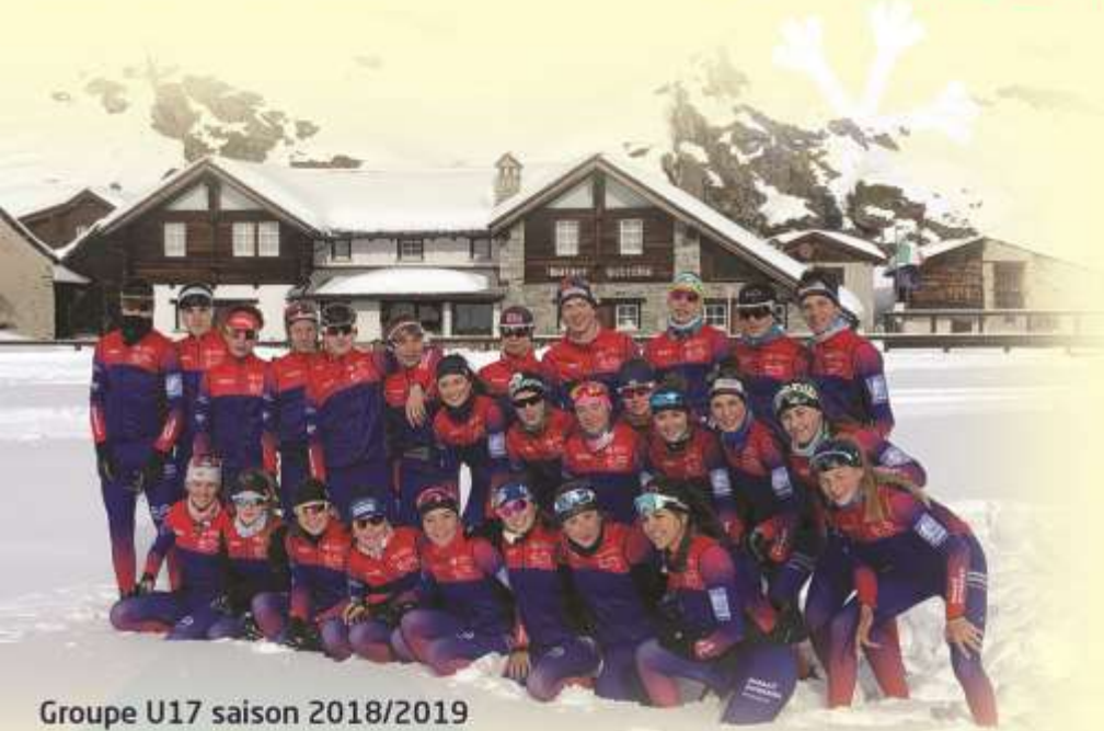
Groupe U17 saison 2018/2019

Espace Nordique Jurassien Montagnes du Jura